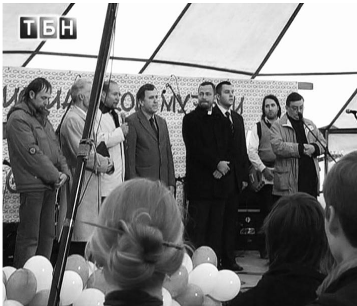
Святенослужыцеляў розных хрысціянскіх канфесій г. Борисова

На працяжэнні доўгага часу в г. Борисове проходзяць рэгулярныя сустрэчы святенослужыцеляў розных хрысціянскіх канфесій, благодаря котрым між веруючымі узніклі дружэскія ўзаемаадношэнні. На адной з сустрэч у святенослужыцеляў узнікла ідэя правядзення неадной праждніка для горада Борисова: веруючыя рэшылі правесці в гораде фестываль хрысціянскай музыкі.