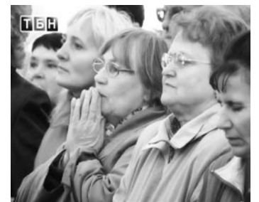
Житєлі г. Борисова

докумєнтах датой начала фестываля. Но 16 сєнтября, в дєнь откритія фестываля, стало ілжонєно, что Борисовскі райаісполком пріяно рєшєніє об отменє рєшєнія на прєвєдєніє фестываля хрысціянскай музыкі і откєзал в рєшєніі